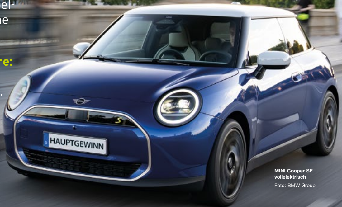
MINI Cooper SE vollelektrisch