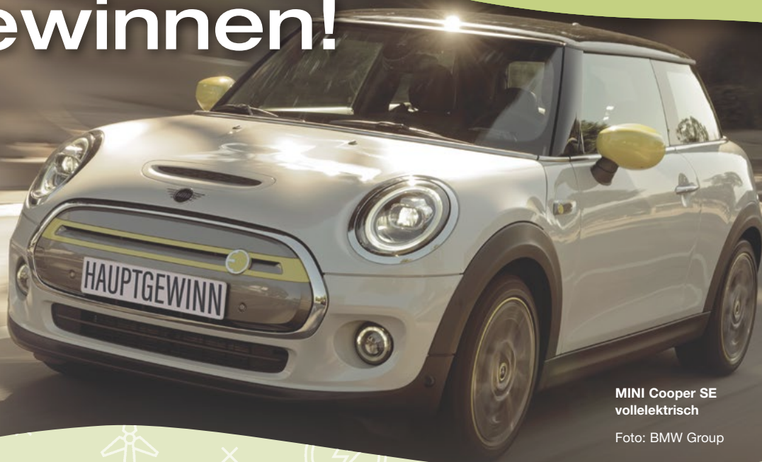
MINI Cooper SE vollelektrisch